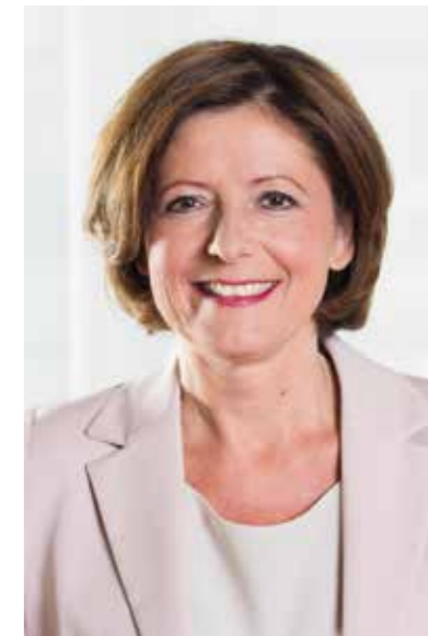
Malu Dreyer Ministerpräsidentin von Rheinland-Pfalz